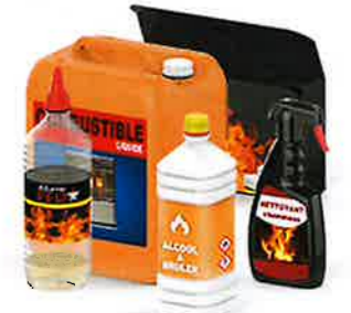
CHAUFFAGE, CHEMINÉES ET BARBECUE

Ne polluez plus votre poubelle, géolocalisez-vous pour trouver le point de collecte le plus proche sur le site : http://www.mesdechets.specifiques.com