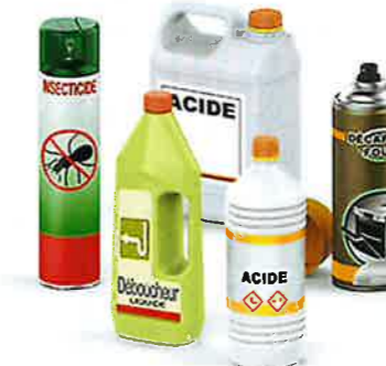
ENTRETIEN SPECIFIQUE DE LA MAISON