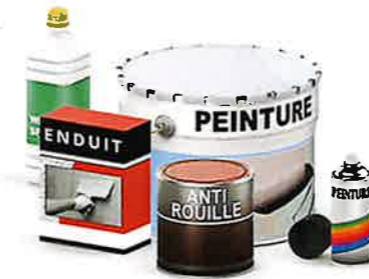
BRICOLAGE & DECORATION