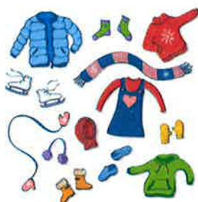
Vêtements de 0 à 6 ans.