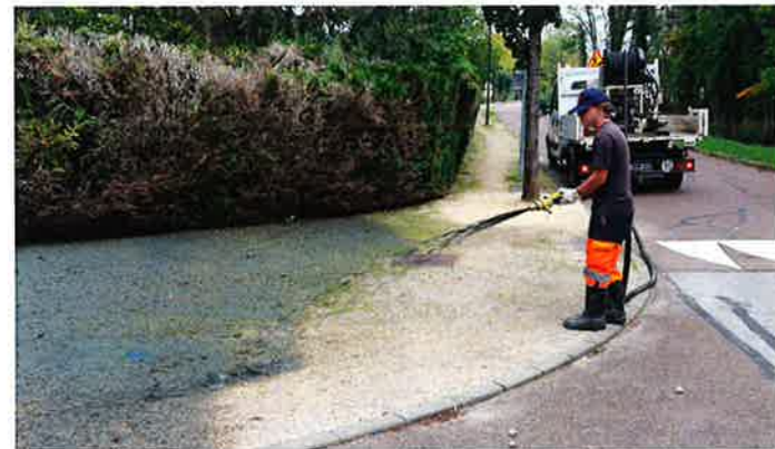
Utilisation d'une machine spécifique louée à l'entreprise NATURALIS

Il n'aura pas échappé aux Dracysiens que la préservation de l'environnement est un point auquel le conseil municipal apporte une attention permanente et soutenue.