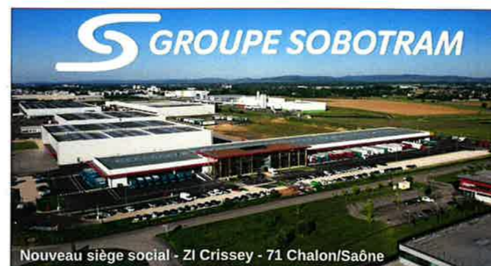
Nouveau siège social - ZI Crissey - 71 Chalon/Saône

Une belle initiative portée par les membres de l'APE qui participent au dynamisme de notre école.